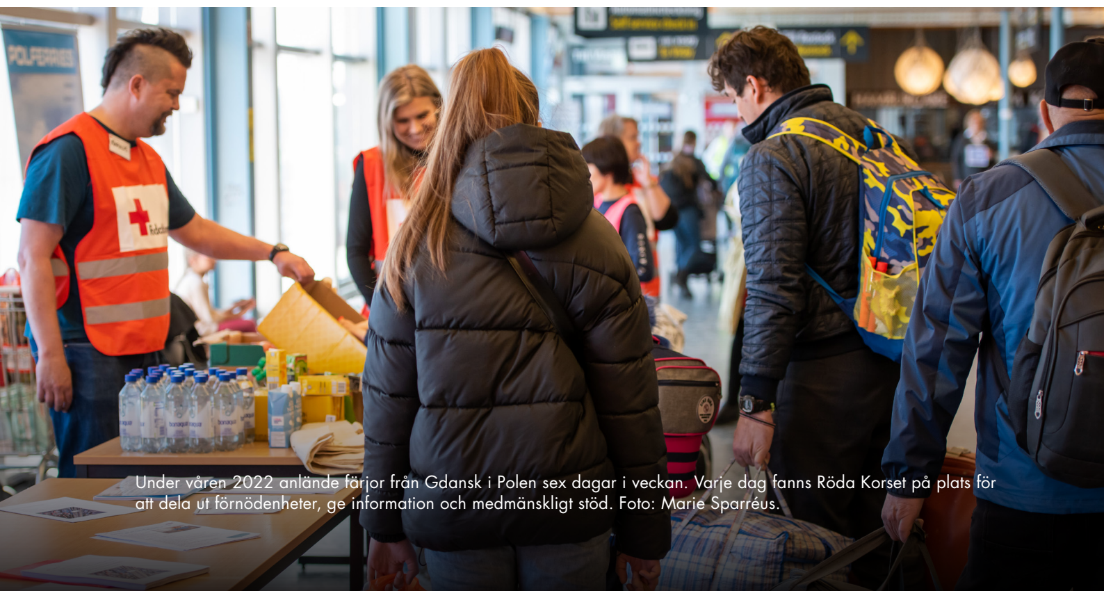
Under våren 2022 anlände färjor från Gdansk i Polen sex dagar i veckan. Varje dag fanns Röda Korset på plats för att dela ut förnödenheter, ge information och medmänskligt stöd.

”Jag kan inte få sekretessbelagd information eftersom jag inte har ett personnummer och jag kan inte logga in på vilken institution som helst. Till exempel sjukvården, mitt barns skolsystem, skattesystemet etcetera.”